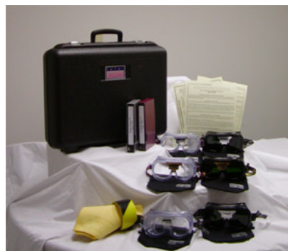
FATAL VISION "STARTER KIT" – DEN OPTIMALA LÖSNINGEN

De finns totalt sex olika modeller, fem simulerar en alkoholpåverkan från 0,6 promille upp till +2,5 promille. Den sjätte simulerar "Double-Vision"